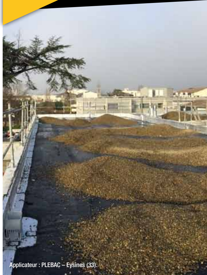
Applicateur : PLEBAC – Eysines (33).

C'est le pare-vapeur ROLL 25 ALPA®, un isolant PU en pose libre ainsi que le complexe d'étanchéité HYRENE® TS CPV + HYRENE® 25/25 TS qui ont été choisis pour ce chantier de 1 400 m 2 de toiture terrasse béton sous gravillons, étanchés entre novembre 2015 et mars 2016.