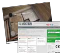
WEBINAIRE Chaîne Étanchéité Axter & Coletanche/YouTube