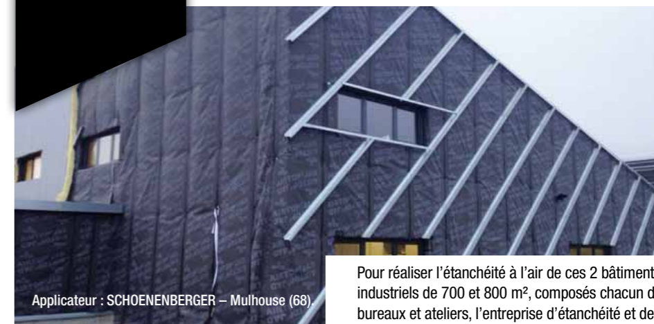
Applicateur : SCHOENENBERGER – Mulhouse (68)

Pour réaliser l'étanchéité à l'air de ces 2 bâtiments industriels de 700 et 800 m 2 , composés chacun de bureaux et ateliers, l'entreprise d'étanchéité et de bardage SCHOENENBERGER a choisi AIRTOP® JAD.