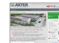
SITE INTERNET www.axter.eu/produit-solution-etancheite