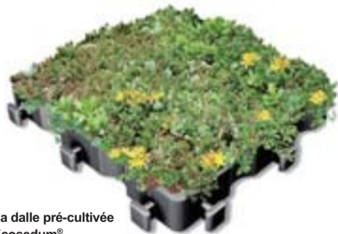
La dalle pré-cultivée Ecosedum®

Les systèmes Ecovegetal®, commercialisés par Axter (voir tableau 2), sont destinés à la végétalisation extensive et semi-intensive des toitures terrasses constituées d'une pente inférieure ou égale à 20% (au-delà, nous consulter).