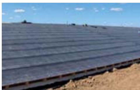
TOPFIX® FMP Grésé posé sur élément porteur bois

Le complexe CITYFLOR®, procédé d'étanchéité bicouche, composé d'une première membrane