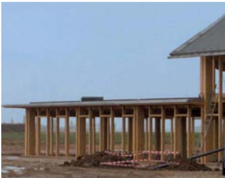
CITYFLOR® posé et prochainement recouvert d'un système de végétalisation

E covegetal vient de débiter la construction de son nouveau siège social à proximité de ses actuels locaux à Broué (près de Dreux). 3 000 m 2 de bâtiments seront ainsi construits. Les produits d'étanchéité posés sont des membranes Axter utilisées par l'entreprise de pose ayant remporté le marché.