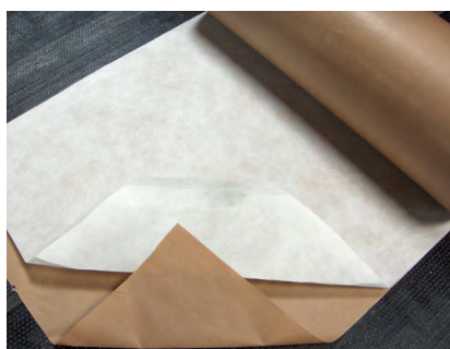
Le DI 100 est un voile de verre, enroulé avec une feuille de kraft, sans être contrecollé. Le voile de verre est composé de fibres entrecroisées.

Une forte résistance à l'eau : le produit conserve 70% de sa résistance initiale à la traction et à la déchirure après immersion dans l'eau à 50°C pendant 24H, conformément au DTU de la série 43.